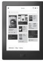
Kobo Aura H20 (6.80", WiFi)