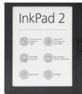
PocketBook InkPad 2 (8", WiFi)