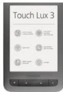
PocketBook Touch Lux 3 (6", WiFi)