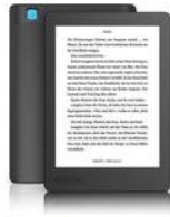
Kobo Kobo Aura (6", WiFi)