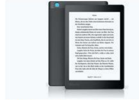
Kobo Aura ONE (7.80", WiFi)